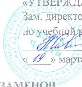
ГРАФИК ЭКЗАМЕНОВ Группа 4СЭД-02 Семестр – восьмой 16 апреля – 18 апреля 2020 г.